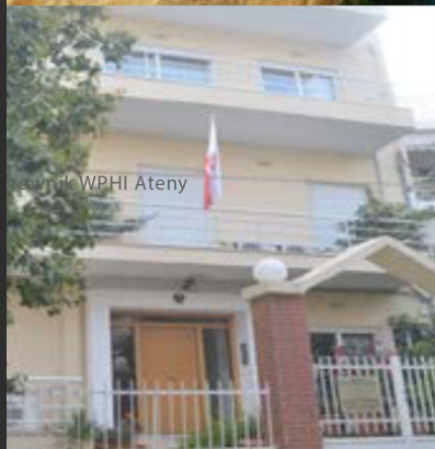
Wydział Promocji Handlu i Inwestycji w Atenach