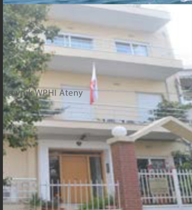
Wydział WPHI Ateny